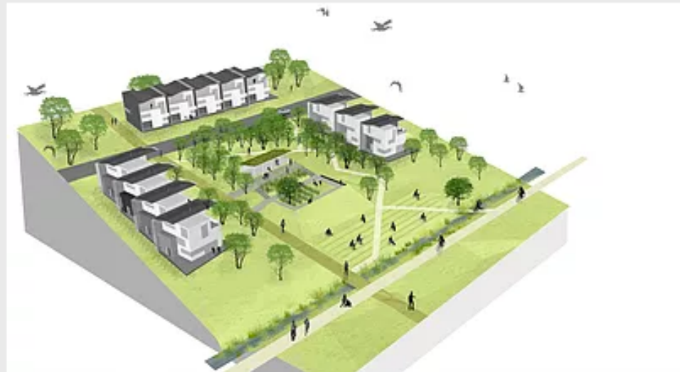
Vistvænt skipulag í Urriðaholti