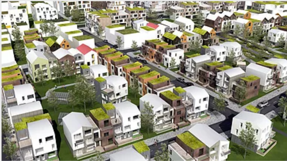
Vistvænt skipulag í Skerjafirði, mynd frá ASK arkitektum