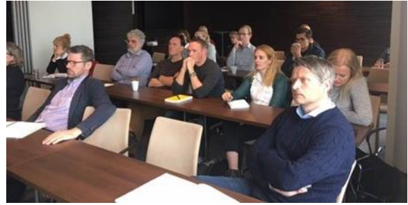
Þátttakendur á málstofu um BREEAM vottunarkerfið