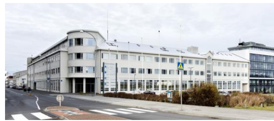
Borgartún 7b, hjá Skipulagsstofnun, Mynd frá Skipulagsstofnun

Vistbyggðarráð flutti starfsstöðvar sínar frá verkfræðistofunni Verkís í Ofanaleiti 2 til Skipulagsstofnunar í Borgartúni 7b í febrúar 2017. Vistbyggðarráð skrifaði undir tveggja ára starfsstöðvarsamning við Skipulagsstofnun og mun því hafa aðsetur þar til 1. febrúar 2019. Vistbyggðarráð er afar þakklátt Verkís og Skipulagsstofnun fyrir velvildina og framlag í formi húsnæðis.